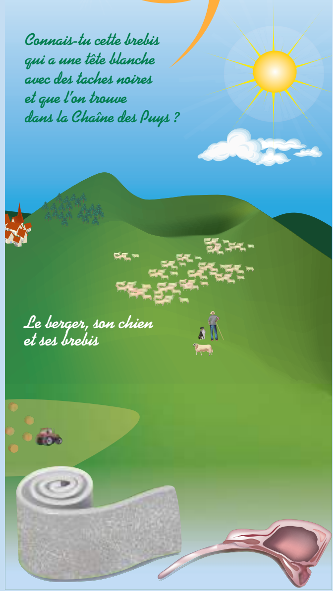
Le berger, son chien et ses brebis

Connais-tu cette brebis qui a une tête blanche avec des taches noires et que l'on trouve dans la Chaîne des Puys ?