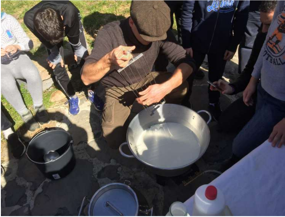
←← Démonstration de la coupe du caillé, fabrication de fromage au lait de brebis