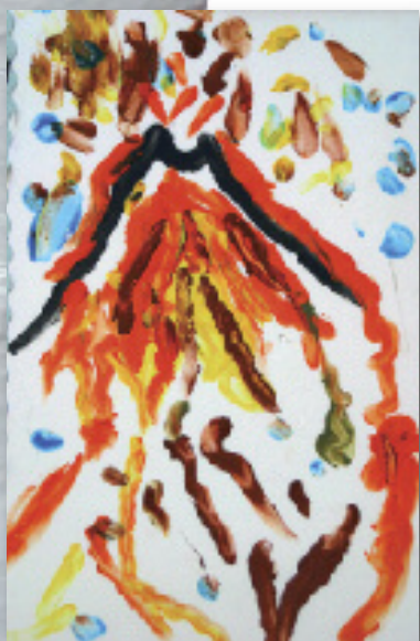
Dessin d'un volcan par l'école de Besse

“La légende du lac Pavin. Le seigneur Roupoutou tomba un jour amoureux d'une jeune femme de Besse. Il lui fit des cadeaux mais la jeune femme le repoussa : il était vraiment trop laid ! Roupoutou continua à lui offrir des cadeaux mais en vain. Un jour, il s'installa sur une chaise en pierre (la chaise du diable) et se mit à pleurer. Il pleura si fort et si longtemps que ses larmes formèrent des ruisseaux. Toute cette eau commença à inonder le village de Besse, qui était au fond d'une cuvette. Voyant cela, les hommes de Besse, qui étaient parmi les plus forts du monde, portèrent leurs maisons un peu plus bas, à la place de l'actuel village. Roupoutou, s'apercevant que les restes du village étaient sous les eaux, pensa qu'il avait noyé la femme qu'il aimait et se jeta dans le lac. On ne le revit jamais plus. On raconte aussi que, si on jette une pierre en plein milieu du lac, le 31 décembre à minuit, on peut entendre sonner les cloches de l'ancienne église de Besse”.