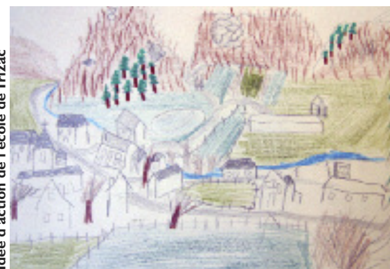
Idee d'action de l'école de Trizac