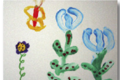
Dessin du Papillon azurée et de la Gentiane pneumonanthe par l'école de Besse

Idee d'action de l'école de Saint - Saturnin (63)