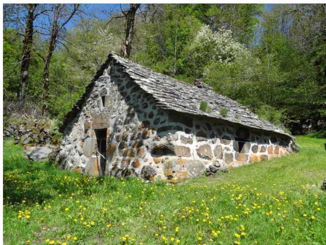
Photo : four à pain daté de 1727, Chavanon, commune de Cheylade.

Les habitants de Saint-Etienne-de-Chomeil et des alentours sont invités à redécouvrir le patrimoine qui ponctue leur quotidien, à partager leurs connaissances et à participer activement au travail d'inventaire, à travers trois ateliers participatifs .