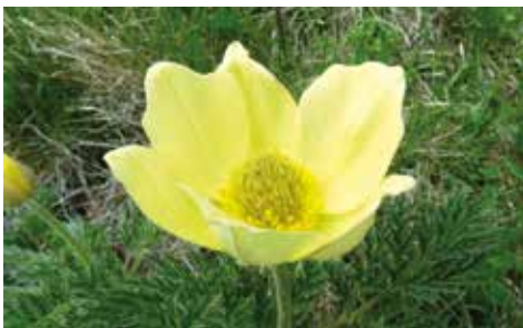
←← Anémone soufrée