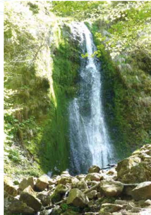
↑ Cascade de Pérouse

Participation dans le respect des gestes barrière en vigueur à la date de l'animation