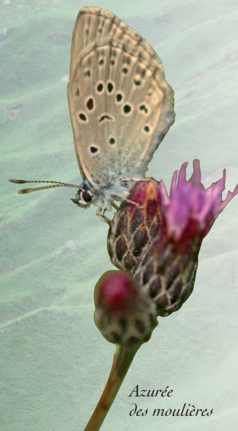
Azurée des moulières