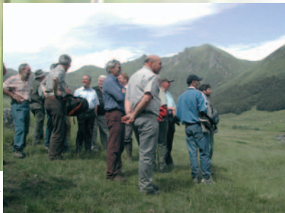
Visite de la réserve naturelle par ses partenaires