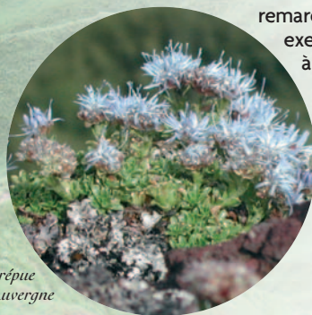
Jasione crépue d'Auvergne