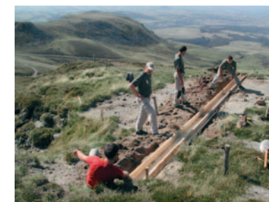
Entretien des sentiers